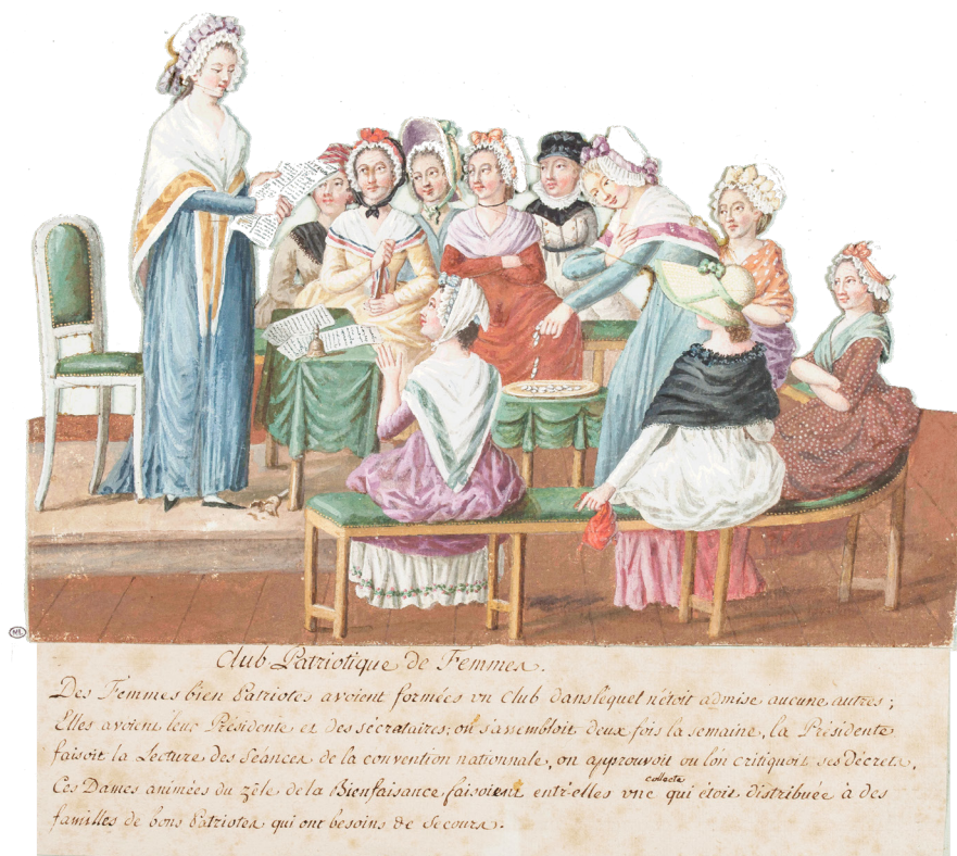
Club patriotique de femmes. Gouache de Jean-Baptiste Lesueur, 1791 © Musée Carnavalet

Charlotte Corday, Olympe de Gouges, Mme Roland comme tant d'autres anonymes ont su, selon ou malgré le contexte politique et social de leur temps, marquer l'histoire de France de leur empreinte.