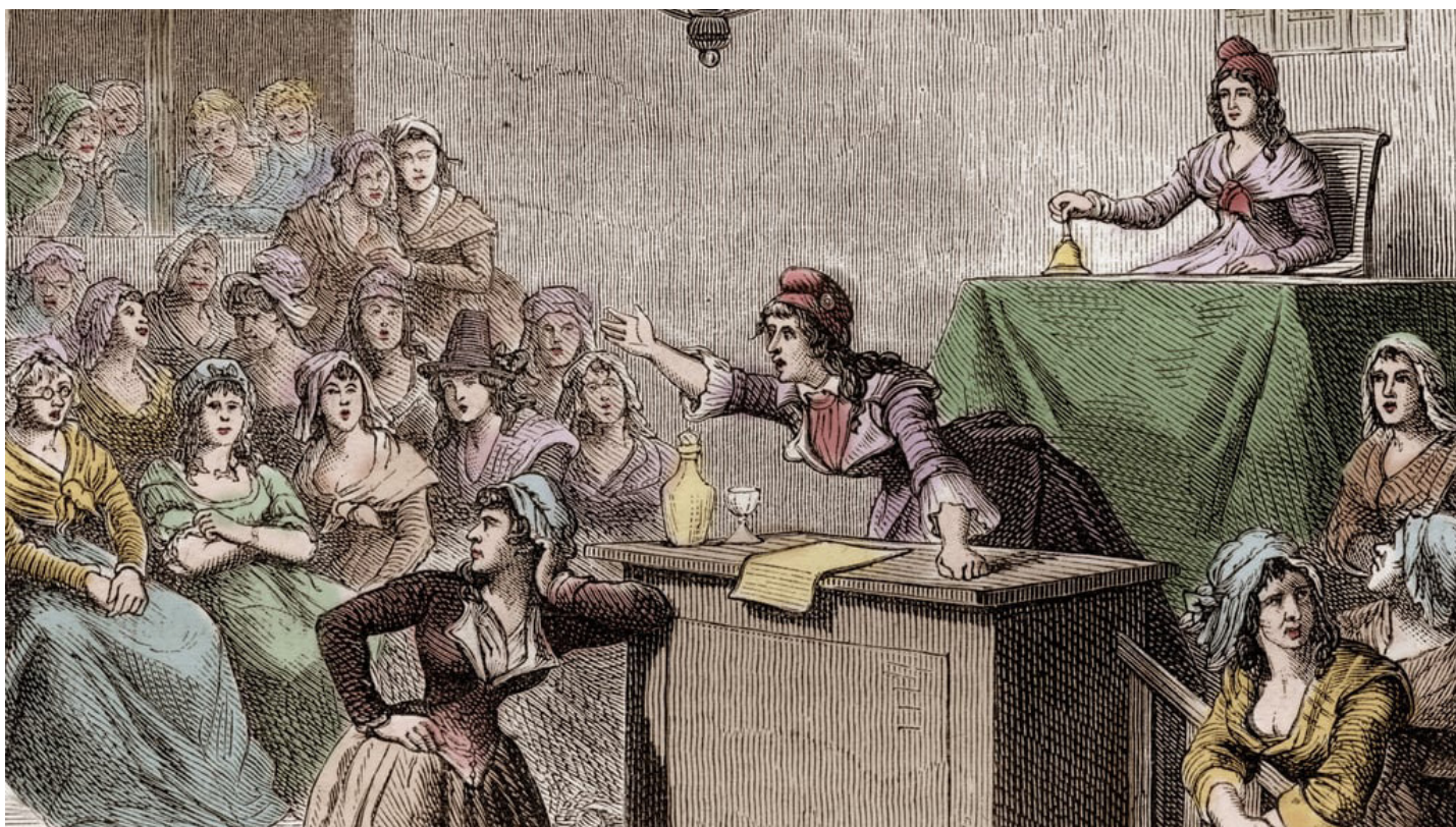
La colère des femmes de Paris, 1789, Gillray, James, Graveur © Musée Carnavalet, Histoire de Paris

Au delà des explications traditionnelles de cette exclusion du corps électoral par la supposé infériorité naturelle des femmes ou la peur des hommes face aux femmes devenues sujet de droit, Anne Vergus propose une autre explication qu'elle nomme conjugalisme :