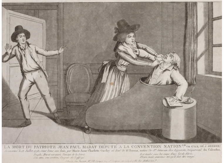
L'assassinat de Marat, estampe, anonyme