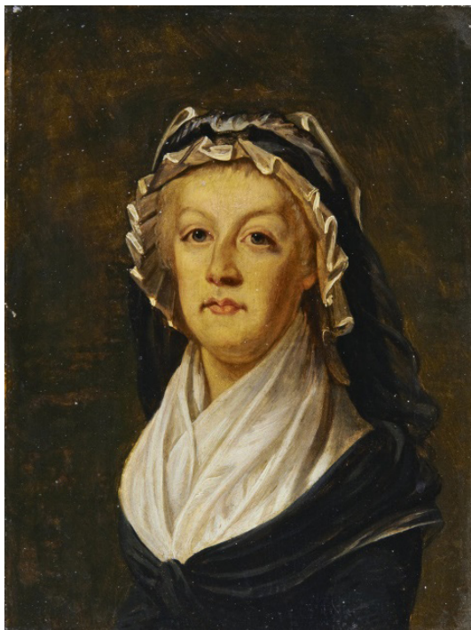
Kucharski Alexandre (1741-1819)

Née le 2 novembre 1755, exécutée le 16 octobre 1793 à l'âge de 37 ans