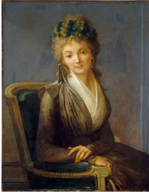
Portrait présumé de L.Desmoulins.

Née le 18 Janvier 1770, exécutée le 13 Avril 1794, à l'âge de 24 ans