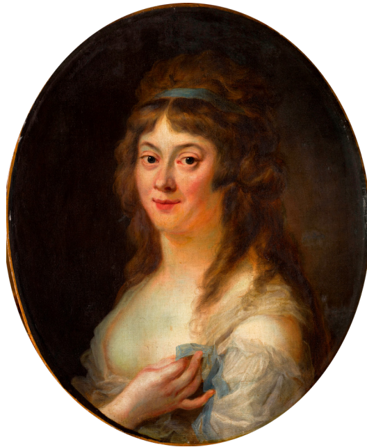
Johann Ernst Jules Heinsius © RMN.Versailles.

Née le 17 mars 1754, exécutée le 8 novembre 1793, à l'âge de 39 ans