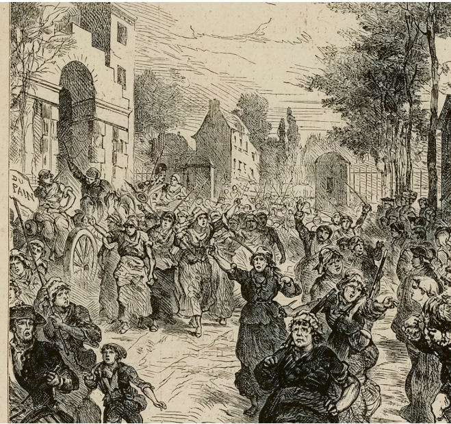
Départ des femmes de la Halle, des poissardes de Paris pour Versailles, le matin du 5 octobre 1789, Léon du Paty, graveur

❖ La participation des femmes à des révoltes de famine, urbaine ou villageoise, n'est pas chose nouvelle.