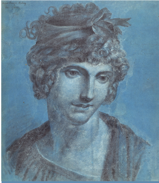
Anonyme © Carnavalet. Roger Viollet

Née le 17 mai 1748, exécutée le 3 novembre 1793 à l'âge de 45 ans