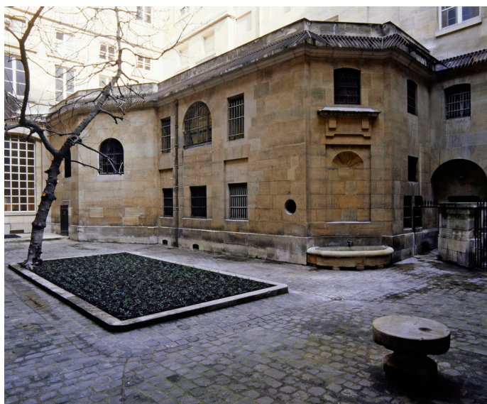
Cour des femmes , Conciergerie

De mars 1793 à juillet 1794, la prison de la Conciergerie compte 579 femmes (soit près de 13% de la population carcérale) dont 387 sont condamnées à mort : 30% pour intelligence avec l'ennemi, 23% pour contre-révolution et 15% pour conspiration.