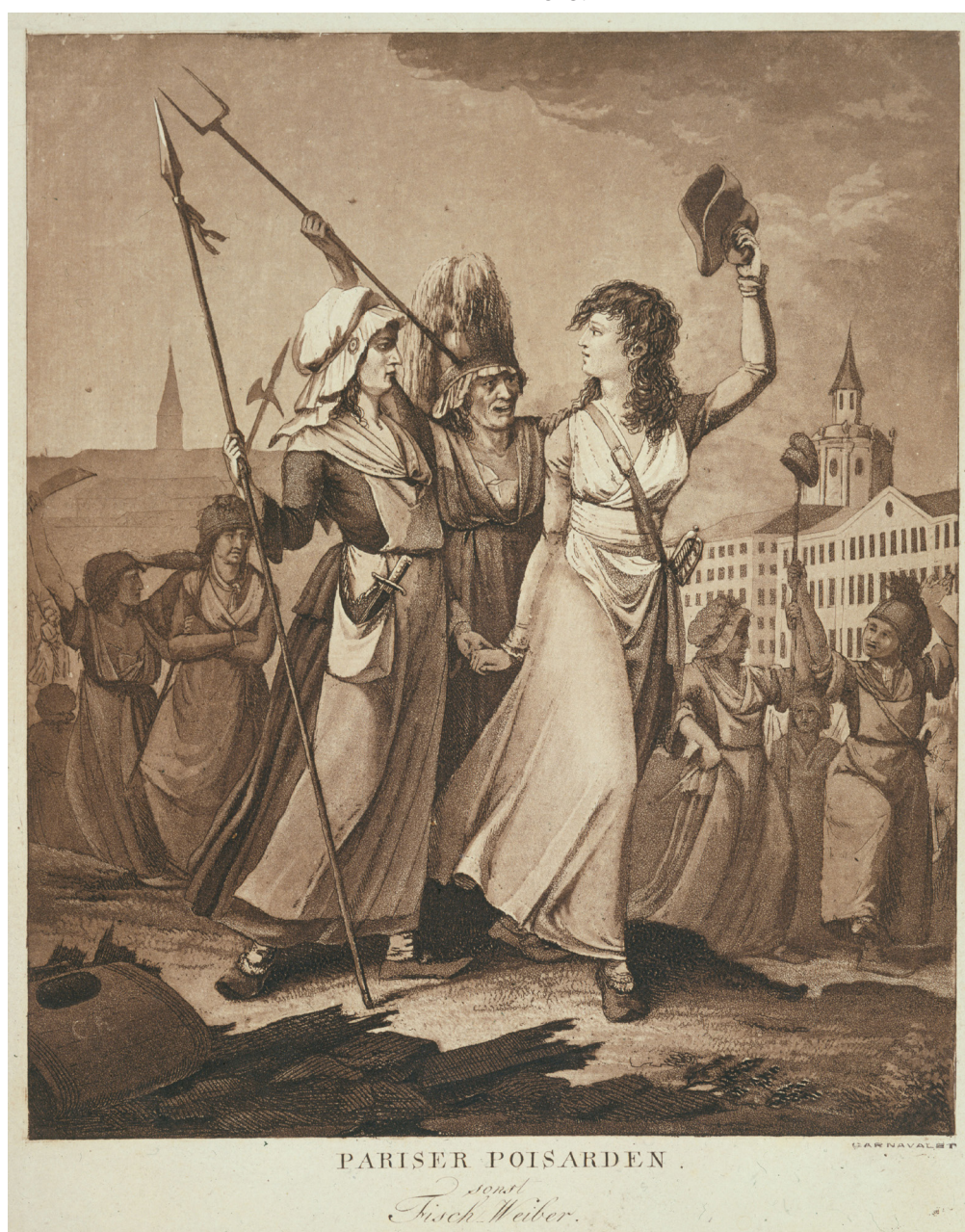
Les poissonnières, anonyme