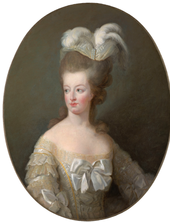
Portrait de Marie-Antoinette par Elizabeth Vigée le brun