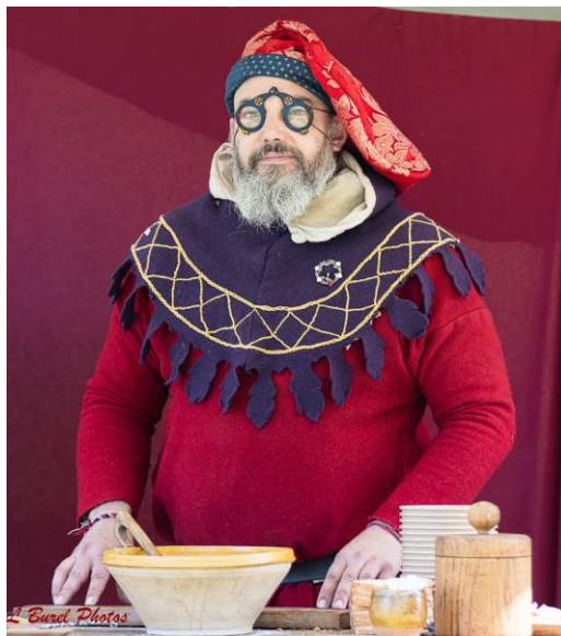
Compagnie La Muse