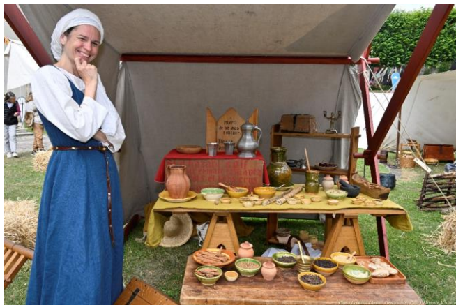
Compagnie La Muse